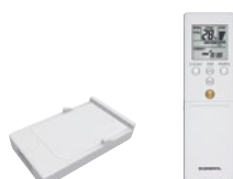
WLAN адаптер (вграден)